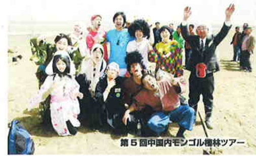
第5回中国内モンゴル植林ツアー