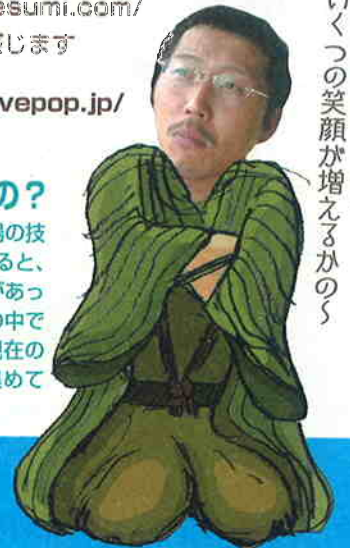
このページの担当: 通販とげんたね担当 カズ魚