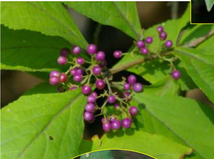
ムラサキシキブ 11月 (G)