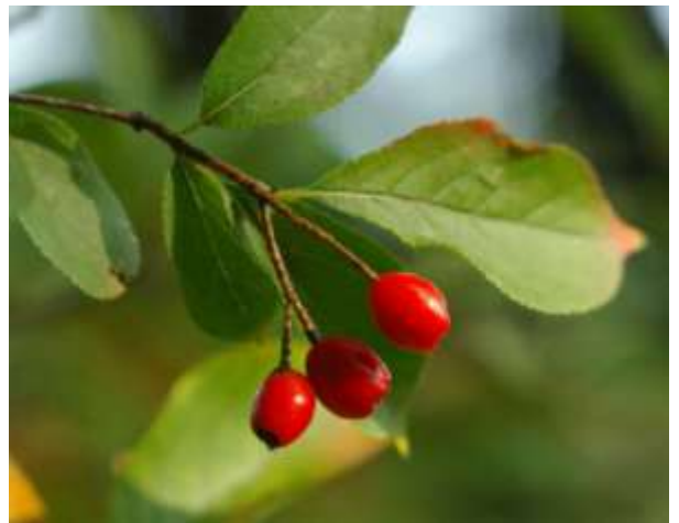
カマツカ 10月 (E)