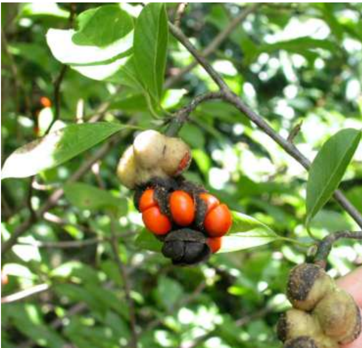
コブシの果袋と赤いタネ（種子）9月 （Aの北斜面）。下はタネの内層

赤い種皮と、その内側のやわらかい肉質は鳥の栄養分にされ、その下の黒い内層が鳥の消化器、砂嚢（さのう）の砂によって傷つけられ（これにより発芽率が上がるという）、体温であたためられ（こちら発芽率アップ）、お空へポイと放出され、種子は糞とともに新地へ降り立つのだ。（高