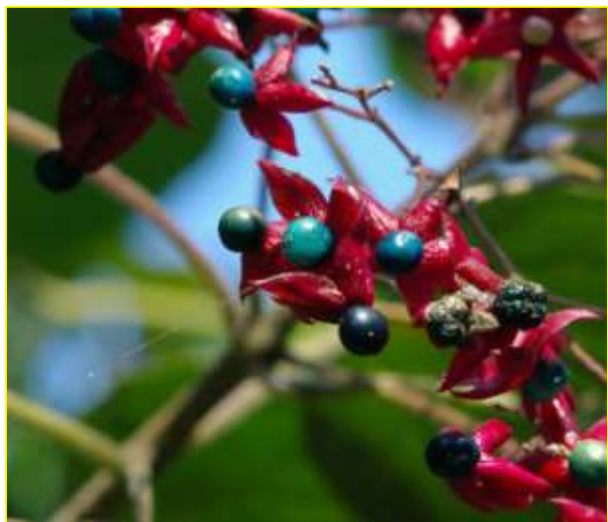
クサギ 10月 (DとEの間)