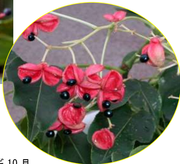
ゴンズイ 10月 (G)