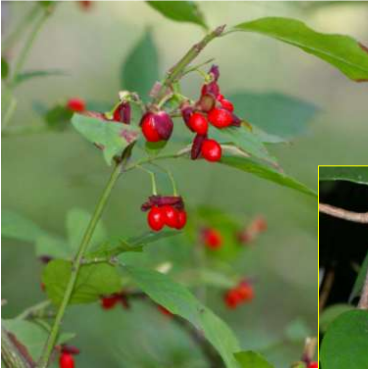
ニシキギ 10月 (F)