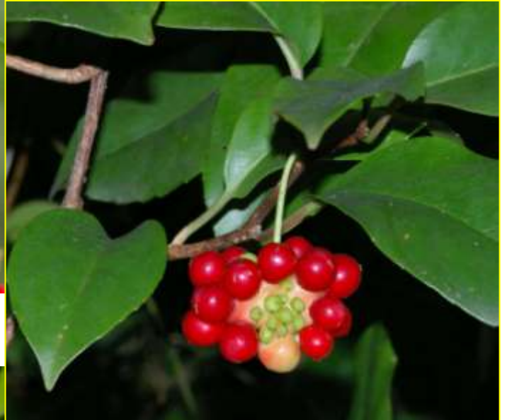
ビナンカズラ 10月 (G)