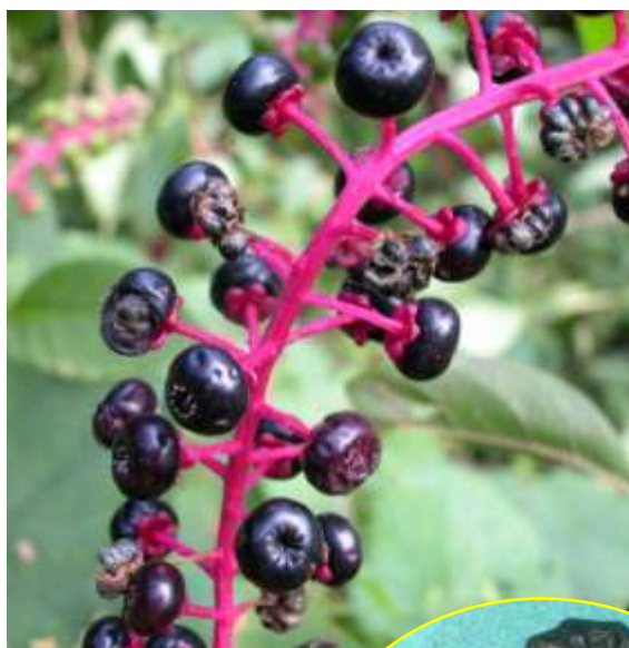
ヨウシュヤマゴボウ