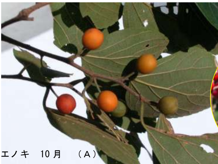
エノキ 10月 (A)