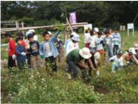
西生田小3年生 そばの学習(9月)