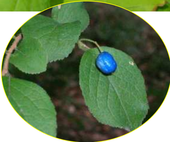
サワフタギ 10月 (G)