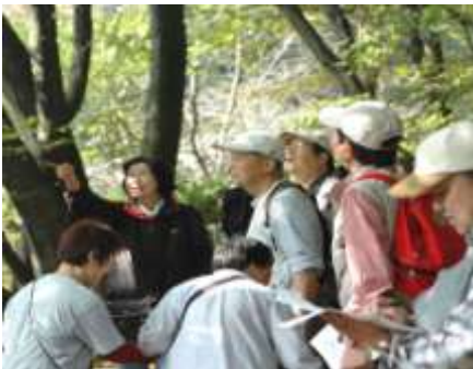
秋の森の観察会(11月)