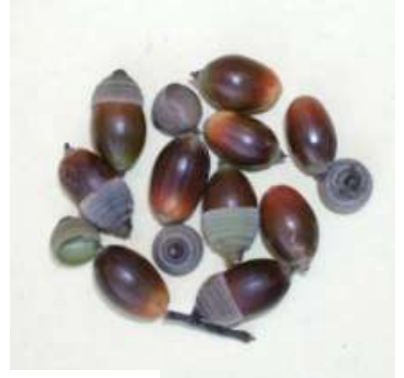
どんぐりのいろいろ 左からクヌギ、コナラ、シラカシ