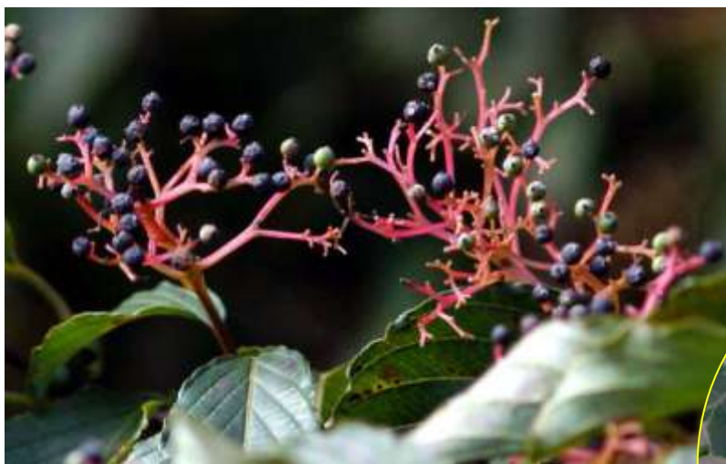
クマノミズキ 10月 (Aの北斜面)

ゴンズイは赤い果実の中に黒い種子、クサギは青藍色の果実を真紅で星形のガクがきわ立たせる。（高橋 英）