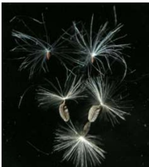
ベニバナ ボロギク