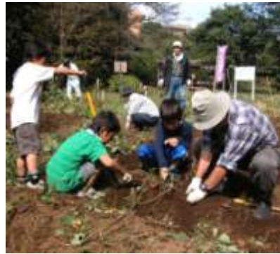
さつまいも掘り(10月)