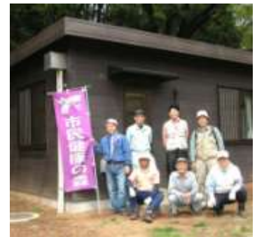
管理棟(多摩美の森の家)

★麻生区市民健康の森は、「麻生多摩美の森の会」が正式スタートしてから6年目を迎え、いこいの里山づくりがすすみ、地域の小学校などの自然観察や山畑の恵み体験の場にもなっています。市民健康の森の東には、「こもればの会」が管理にあたる多摩緑地保全地区が広がり、西には「多摩美みどりの会」中心に保護・育成を続けている多摩美ふれあいの森・日本たんぽぽ園・野草園があります。