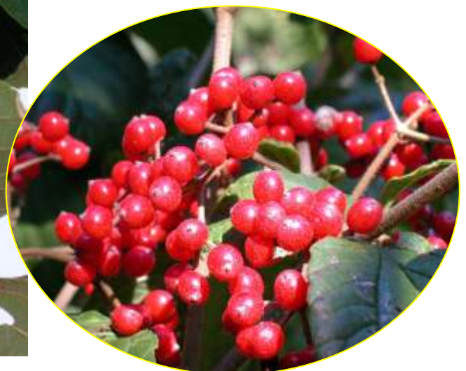
ガマズミ 10月 (CとDの間)