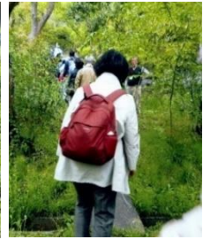
円応寺から白井城 址に向かう山道