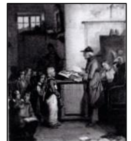
田舎教師の授業風景 (フランス1830年代)

教育の場として「学校」が登場した当時は、教場はあっても、学級や教室はなかったのです。勉強の進み具合も、年齢もマチマチの子どもたちが、一緒に勉強していたのです。いったいどのような変遷を経て、現在のよう姿になったのか。皆様もご一緒に考えてゆきませんか。