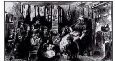
おばさん学校と揶揄された ロンドンの私設学校 (イギリス1840年頃)