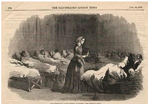
傷病兵を見舞い、様子を聞くフローレンス 「ランプの天使」の呼称は、ここから生まれた (1855年1月)

クリミア半島での戦闘が激しくなって(セヴァストポリ要塞の攻防戦)大量の負傷者が出たこと、戦地の不衛生から多数のコレラ患者が発生したことなどで、200人を超える傷病兵がスクターリに移送されてきたことによって、状況は変わりました。人手が足りなくなった軍医と司令官は、フローたちの手を借りざるを得なくなったのです。38人の看護士たちは、フローの慧眼に感心し、この