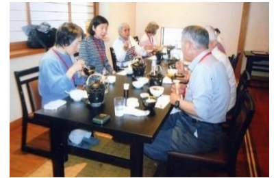
一幸ゆうかりが丘店での食事風景

定刻8時に新百合ヶ丘を出発、渋滞に巻き込まれて50分遅れで歴史民俗博物館に到着。常設展を見学しました。原始・古代から、現代まで、民俗の部屋を含めて全6室。その広いこと広いこと。1室を丁寧に見ていると、とても2時間の見学では、見切れないほどの広さがあり、各自興味のある部屋中心の見学になりました。撮影禁止のため、写真はなし。