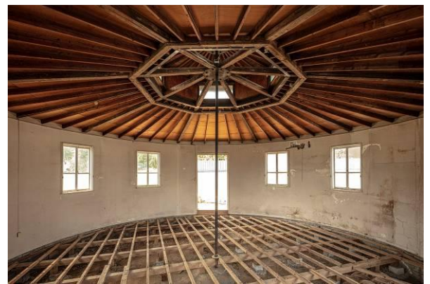
写真3. 改装工事で一室空間となった内観

かつてこの建物で齒科診療を受けられた方など、昔のご記憶がある方はぜひ情報をお寄せください。