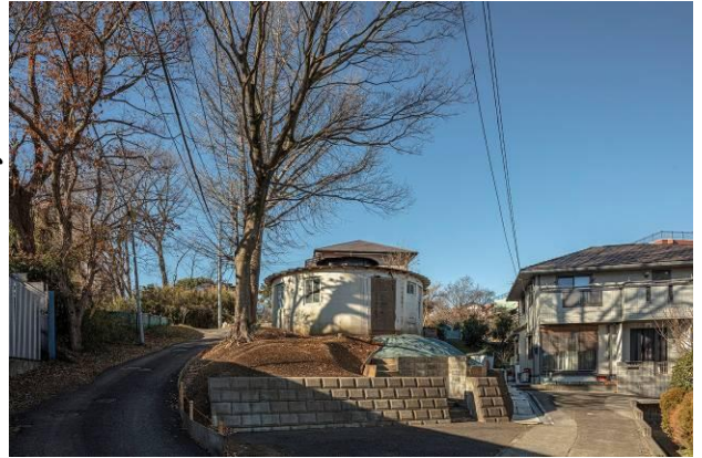
写真1. 旧神谷齒科外観(令和4年1月)

かつてこの建物で齒科診療を受けられた方など、昔のご記憶がある方はぜひ情報をお寄せください。