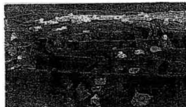
(野川神明社南遺跡発掘現場)

橘郡の実像を知る大きな手掛かりとなるものが740年聖武天皇の命で行基が建立したといわれる影向寺である。発掘調査の結果、それより前の7世紀後半の白鳳時代のものとされた。発見された瓦から同寺が橘樹郡の公式な寺であったという可能性が高いという。