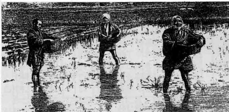
(「摘田」の種蒔き風景:明治時代)