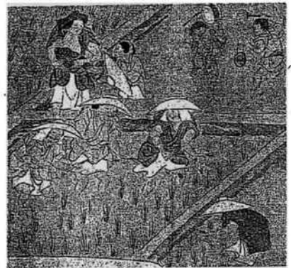
(室町時代の田植の様子:たわらかさね耕作絵図)

この方法は、一般的に古い時代になくなってしまったもので「摘田(つみた)」「蒔田(まき)」と呼ばれていました。しかし柿生・岡上では大体、明治時代の終わり頃から大正時代まで続いていたようです。一部1960年頃まで行なっていたところもあります。タイなど東南アジアのいくつかの国では、現在でも田に種籾を直接蒔いている地域もいくつかあるようです。「摘田」は柿生・岡上の全域で行なわれていたようですが川崎市内では多摩区の五反田・菅、宮前区の有馬・土橋・馬絹・平でも行なわれていたという記録があります。もちろん田植えで行なう「植田」も併用して行なっていたようです。歴史的には、「摘田」「蒔田」が古く、古代はこの方法が行なわれていたのでしょうか。しかし平安末期の「鳥獣人物戯画」には、田植え祭りの芸能である「田楽(でんがく)」に関する絵が描かれていますのでこの頃にはすでに「植田」は始まっているものと思います。(次ページに続く)