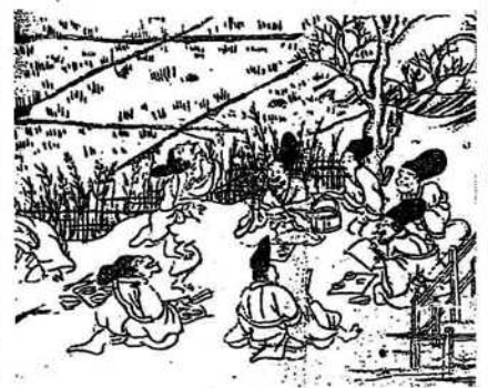
(「年中行事絵巻」にみられる田:平安時代末期)