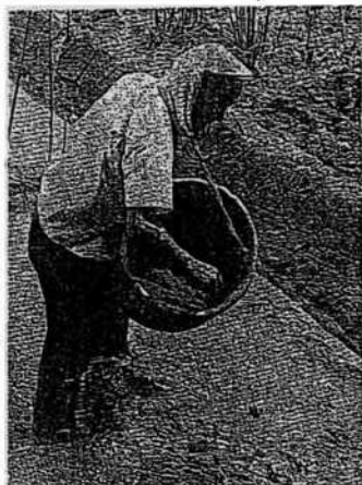
(摘田の種蒔き:青葉区恩田町)