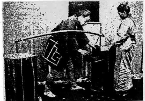
幕末期の漬物屋(フー・イスト誌掲載写真より)

祖先の活動があったからこそ今日の私たちが存在したということは決して忘れてはいけないことだと思います。祖先の思いを知ること、きっと、私たちの生活をより豊かにしてくれることでしょう。