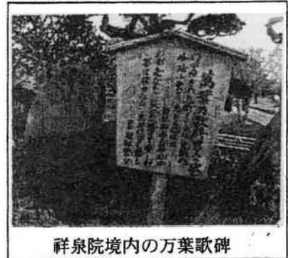
祥泉院境内の万葉歌碑

都筑の防人の歌碑には、「わが行きの 息衝（つ）くしかば足柄の 峰延（は）ほ雲を みとと偲はね」「わが夫なを 筑紫へ遣りて愛（うつく）しみ 帯は解かなな あやにも寝も」の二首が記され、防人に送られていく農民夫婦に悲哀と情愛に胸を打たれます。橘樹の歌碑には、「家ろには葦火焚（あしびた）けど住み好けを筑紫に到りて恋しけもはも」「草枕旅の丸寝（まるね）の紐絶（ひもた）えば我が手と付けろこれの針持（はりも）し」と二首記されており、葦火で焼けても離れ難い竪穴の住居、夫の旅路を気遣う妻、夫婦の惜別の思いがひしひしと感じられてまいります。