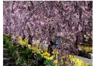
日中線跡地の”しだれ桜”