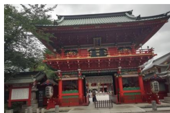
神田明神・隨身門