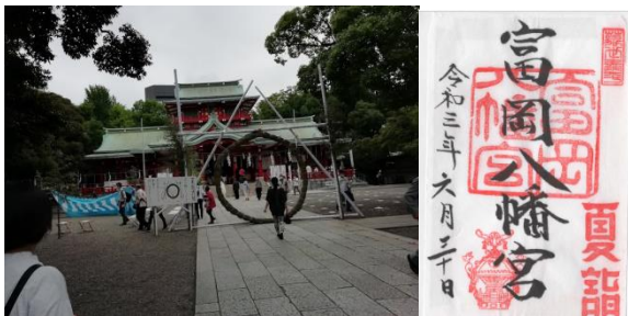
4回目の茅の輪くぐり

門前仲町駅から地上に出ると深川不動商店街で、不動入口を少し進むと、10分ほどで兄弟喧嘩で有名になってしまった富岡八幡宮に着く。4回目の茅の輪くぐりとなった。