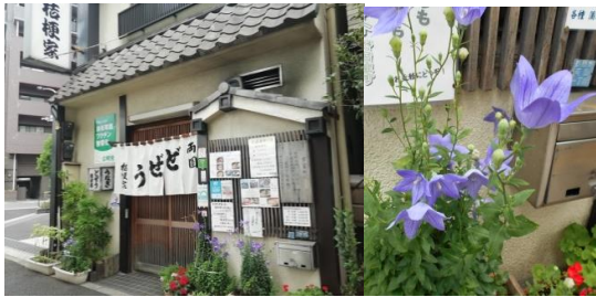
両国 どぜう 桔梗屋

12時半頃に着いたのに客は一人だけ。去年の浅草飯田屋より小ぢんまりした店で、料理の値段も安いようだ。