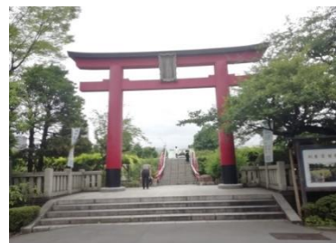
亀戸天神: 鳥居の向うに太鼓橋

大きな鳥居の向こうには太鼓橋があって、拝殿の屋根だけが見える。太鼓橋の上からは、左に東京スカイツリーが、正面の眼下には拝殿を眺めることができる。