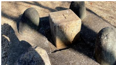
鳶尾山一等三角点

その時は写真を撮るだけで、それほど気に掛からなかったのですが、相模野基線の一等三角点が、我が家からも比較的近くにある、日本最古の三角点網に興味を持ち始め、三角点のことを色々調べるようになりました。