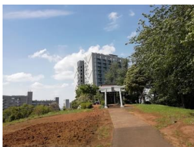
飯縄神社と東京工业大学

田園都市線すずかけ台駅で下車し、東京工业大学裏の小高い丘に飯縄神社があり、そのベンチの脇に一等三角点がありました。