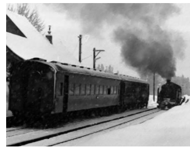
旧日中線の懐かしい写真