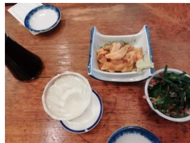
いろいろ食べました。

初めからお酒を頼み、ホヤ刺し・ニラ・イカなどの他にアラ煮を注文。アラ煮は昔は50円だったが、70円に値上がりしていた。