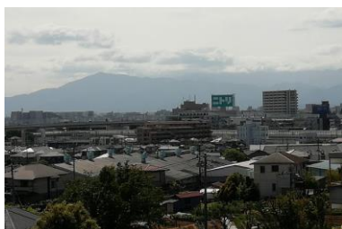
遠くに大山を望む