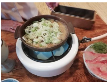
鍋にネギを乗せる