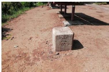
ベンチ脇の一等三角点