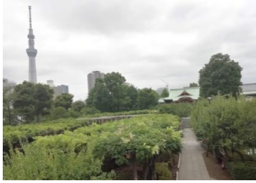
東京スカイツリーと拝殿