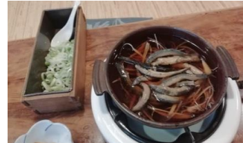
ゴボウ付のドジョウ丸鍋

インドネシア滞在中に女中が作ってくれた「モドキ」を思い出す。柳川鍋のドジョウ無しの「柳川モドキ」の事だった。近くの池で釣った鯉をアライにして食膳に出したが、社員の誰もが箸を付けなかった事も思い出した。