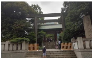
東京大神宮・鳥居