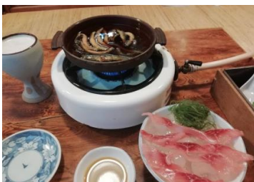
ドジョウ丸鍋と鯉のアライ