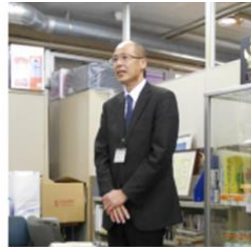
カジノヤ納豆工場見学:2018. 2. 7