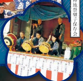
神地祭囃子保存会