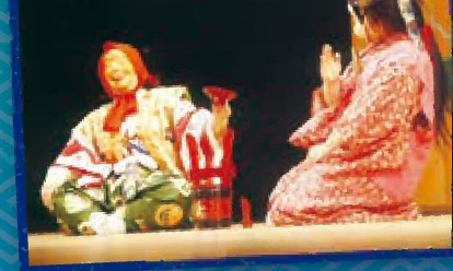
若宮八幡宮囃子保存会