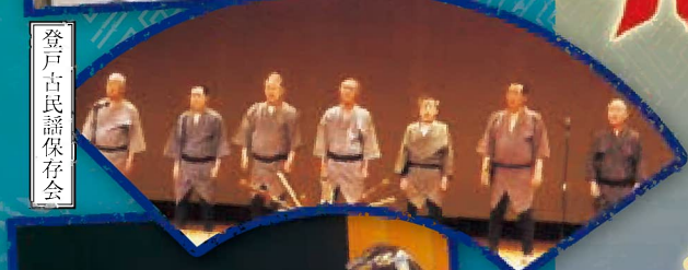
登戸古民謡保存会