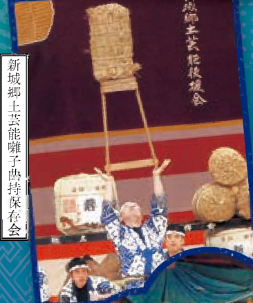
新城郷土芸能囃子曲持保存会