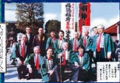
大師古民謡保存会