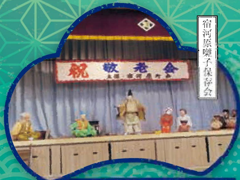
相模原囃子保存会