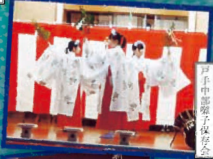
戸手中部囃子保存会