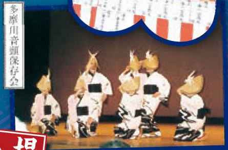
多摩川音頭保存会