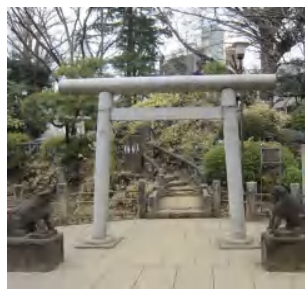
鳩森神社:最古の富士塚