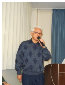
Yさん：東京の富士塚