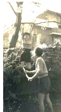
欠席のUさん：高輪の思い出