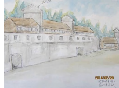
防空壕のあった小学校