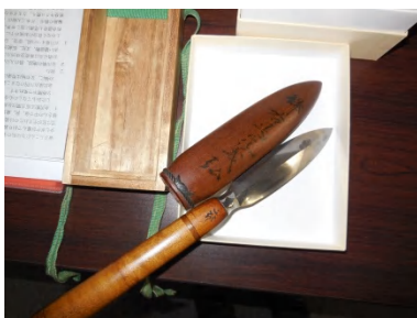
S家の家宝 槍の穂先