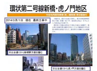
大規模開発が進む虎ノ門界隈