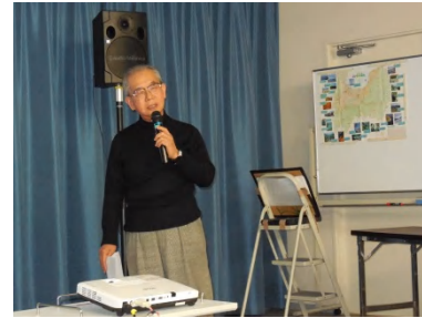
Iさん： 上野、下谷での思い出、ガキ大将だった頃、 吉原のやり手バーさんと吉原言葉