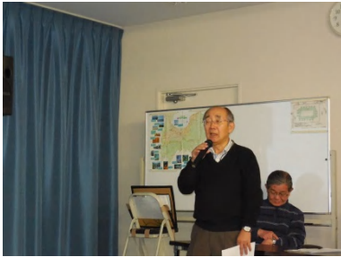
Mさん： 渋谷、笹塚、初台、幡ヶ谷の地名の謂れ