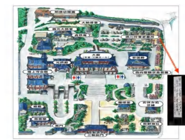
増上寺：徳川家の菩提寺