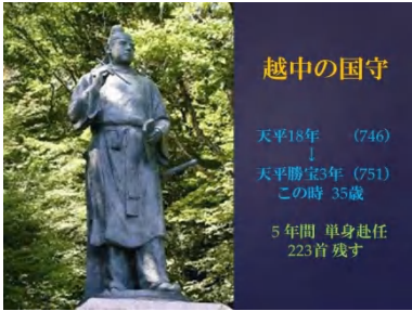
大友家持の歌（朗詠付き）