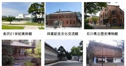
美術館・博物館・記念館