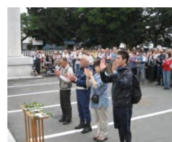
7/1の山開きには富士塚に登ろう！