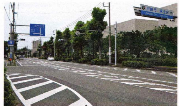
完成後のイメージ