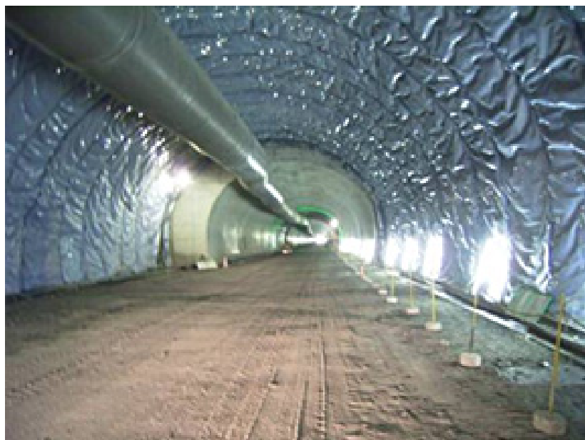
防水シートの施工例