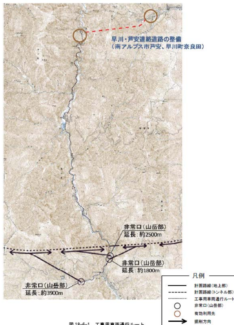
図 18-6-1 工事用車両通行ルート