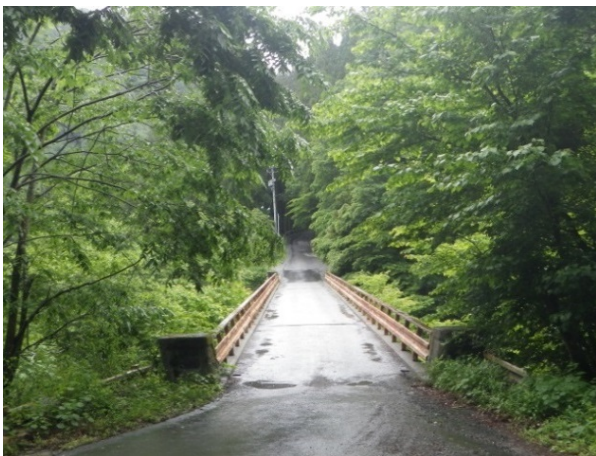
(長野県) 県道 253 号 (赤石岳公園線) の現況 (評価書【長野県】8-5-2-9 ページ)