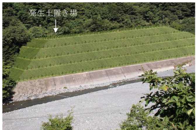
(静岡県) 発生土置き場の完成直後のイメージ (評価書・資料編【静岡県】環 11-1-11 ページ)