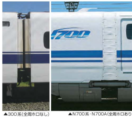
車両の平滑化による走行抵抗の低減の一例